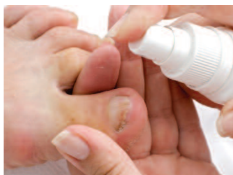
5. A kezelt köröm fertőtlenítése.