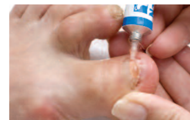
12. A gombaölő, modellező anyag felhordása a köröm felszínre. Kifejezetten a gombás körömre kifejlesztett összetételű (többféle árnyalatban választható, átlátszó, bézs, rózsaszín).