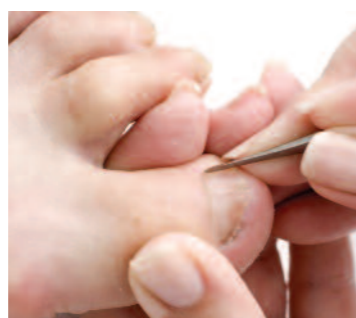
6. A kezelt köröm és a körömsánc alapos előkészítése.