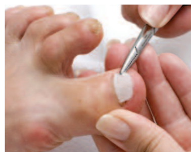
11. A kiszabott korrekciós szövet próbája a köröm felszínére.