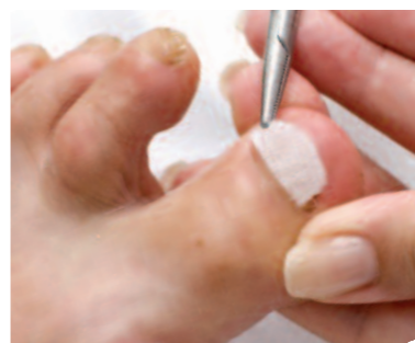
14. A korrekciós szövet illesztése.