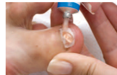
15. A modellező anyag következő rétegének felhordása. A modellezett köröm formázása, felületének kezelése, lakkozás, ápolás.