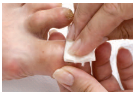
8. A köröm speciális anyaggal történő zsírtalanítása.