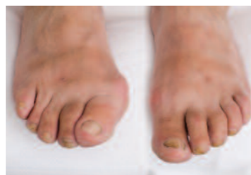
2. Beteg lábak.

A gombás köröm nyáron esztétikai és egészségi probléma egyszerre. A megoldás: a beteg köröm korrekciója javítja az esztétikai képet és a speciális modellező anyag célzott hatóanyag-tartalma elősegíti a köröm gyógyulási folyamatát.